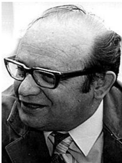
Jan Otčenášek (19.11.1924 Praha – 24.2.1979 Praha)

Jan Otčenášek byl autorem společenských realistických próz a scenárista. Řada jeho děl byla zfilmována.